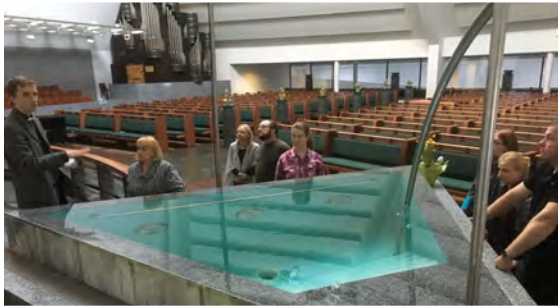
Tiistai-illan tutustumisvuorossa Tallinnan metodistikirkko. Täällä metodeilla on käytössä useita kastekäytäntöjä – tutusta lapsikasteesta upotuskasteeseen.