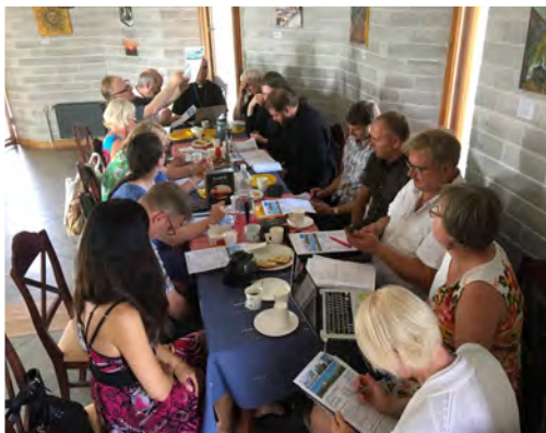
Narvan seurakuntien pastoreita ja vastuunkantajia kirkkopäiväpalaverissa heinäkuun lopulla.

Aika osuva kehoitus tuo piirakkafestivaalin kylttimme: lepuuta jalkoja ja juo vettä! Viime päivät on ollut aikamoista lentoa Narvan aktioviikon valmistelujen ja Lasnamäen syyskauden käynnistämisen merkeissä. Olen sellainen järjestelijäluonne, että tällaisena aikana sitä vaan porhaltaa eteenpäin, eikä ole niin helppoa rauhoittua lepäämään. Tänä aamuna huomasin, että olin unohtanut kahtena aamuna ottaa verenpainelääkkeitä... Yritän olla huoleellisempi huomenna alkavan aktioviikon aikana.