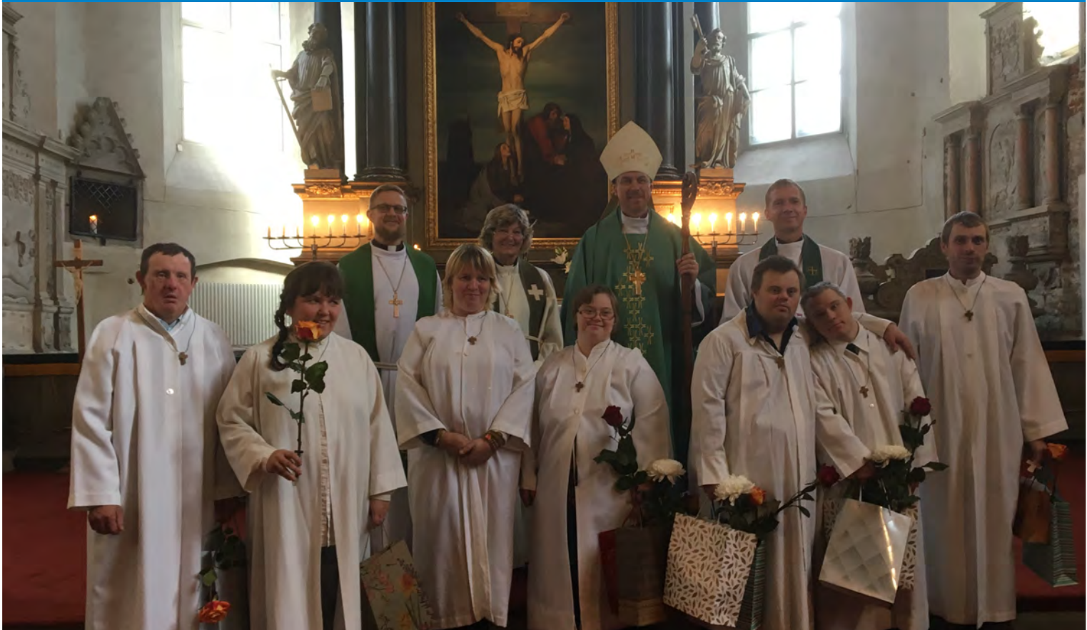
Kehtysvammaisten rippikoulun konfirmaatio Tallinnan tuomiokirkossa 21.10.2018