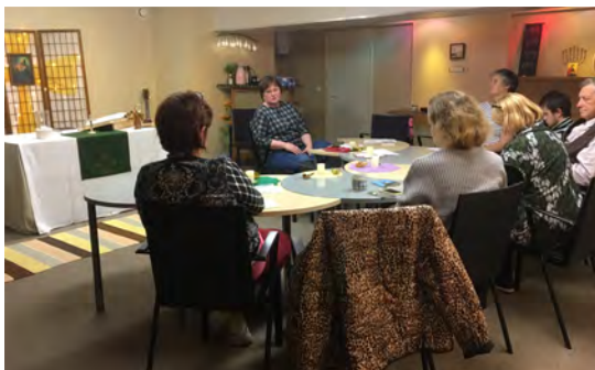
Rippikoulutunti Pae palvelkodassa 16.10.