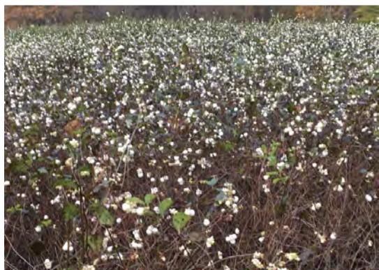
Syksyinen lumimarjameri Keila-Joan puistossa!

Terveiset Ryttylästä! Tulin tänne viideksi päiväksi Kansanlähetyksen työalueiden esimiesten ja edustajien päiville. Matka kotiovelta yli Suomenlahden taittui noin viidessä tunnissa. Monet matkustivat paljon kauempaa mm. Siperiasta, Japanista ja Afrikasta! Uskon, että edessä on antoisa ja työntäyteinen viikko. On avartavaa kuulla välillä kokemuksia ja ajatuksia muilta työalueilta käsin, kun itse olen jumahtanut Viroon jo kahdeksi vuosikymmeneksi.