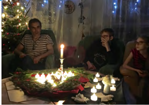
Aatonaaton iltahetki Veskimän ystävien kanssa.