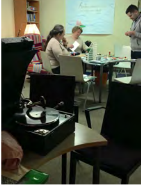
Gramofoni loi tunnelmaa!