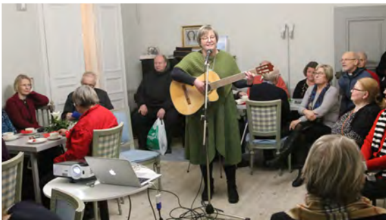
Kirkkokahvit Maarian pappilassa