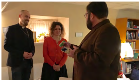
Lappalaisten läksiäiset Lasnamäellä

Päivän tunnussana tänään: Kuljen tai lepään, kaiken olet mitannut, perin pohjin sinä tunnet minun tekemiseni.