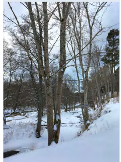
Talvinen kävelyretki Keila-Joan puistossa eilen, 19.1.2019.