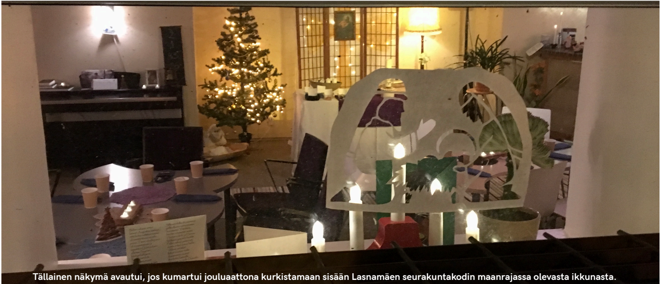
Tällainen näkymä avautui, jos kumartui jouluaattona kurkistamaan sisään Lasnamäen seurakuntakodin maanrajassa olevasta ikkunasta.