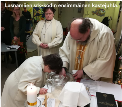
Lasnamäen srk-kodin ensimmäinen kastejuhla