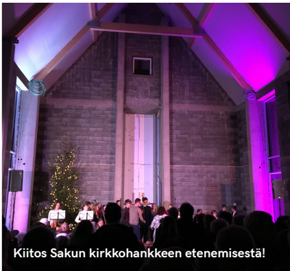
Kiitos Sakun kirkkohankkeen etenemisestä!