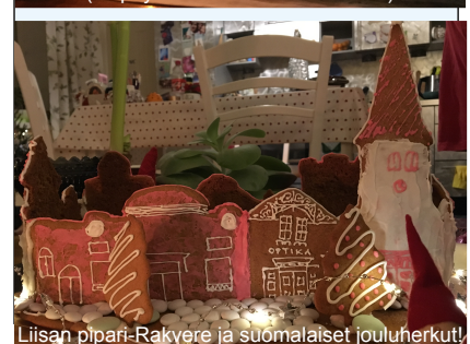
Liisan ppari-Rakvere ja suomalaiset jouluherkut!