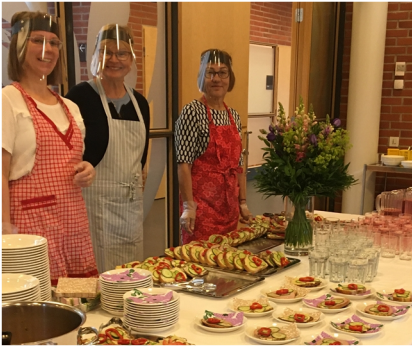
Korona-ajan kahvitarjoilu Turku-aktiossa.