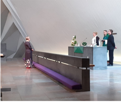
Hyvinkään seurakunta siunasi minut nimikkolähetiksi 23.9.