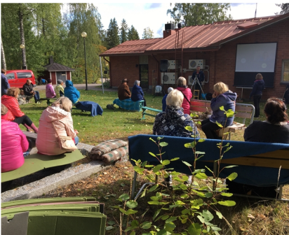
Lappeenrannan seurakuntayhtymän leiripäivässä viime lauantaina matkustettiin nimikkolähetysten luo ympäri maailmaa. Minä pääsin paikalle livenä.