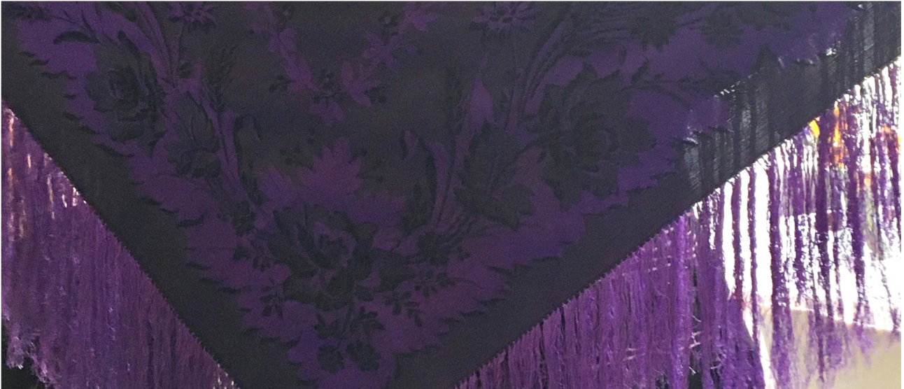
Mamin - mummoni - isoäidin kihlasilkki lienee kudottu 1800-luvun puolivälissä.