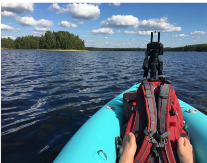
Retkipäivien maisemia: meloen Luumäen puolella, patikoiden Savitaipaleella.