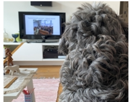
Lauantaina Ruskakin oli mukana Ryttylän Idäntöypäivillä. Inkerin kirkon innostavat kuulumiset tuntuivat kiinnostavan sitäkin!

Uutena tavoittavana etätönnä muotona ajattelimme kokeilla Teamsissa ilosanomapiiriä keskiviikkoisin klo 14, ensialkuun hiljaisesta viikosta helluntaihin. Rukoilethan, että osaisimme heittää mainosverkkoja oikeisiin paikkoihin ja kohdata niitä, joille tällainen keskustelupiiri voisi olla tervetullut ovi seurakuntaan ja Jumalan tuntemiseen.