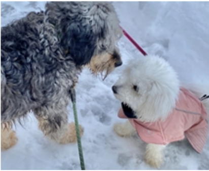
Tommi-veljen perheen valkea karvapallo lines oli vähän pieni peuhukaveriksi.