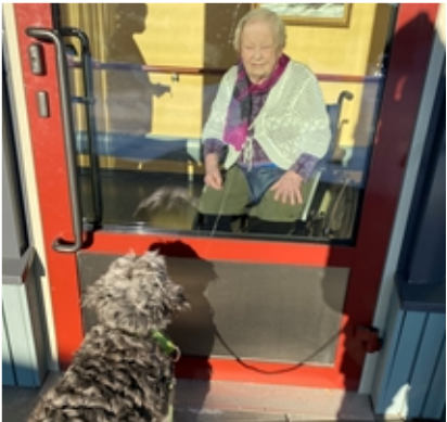
Äitiä pääsin tällä kertaa tapaamaan vain turvallisesti ikkunan läpi. Äänilyhteys toimi puhelimen kautta. :-)