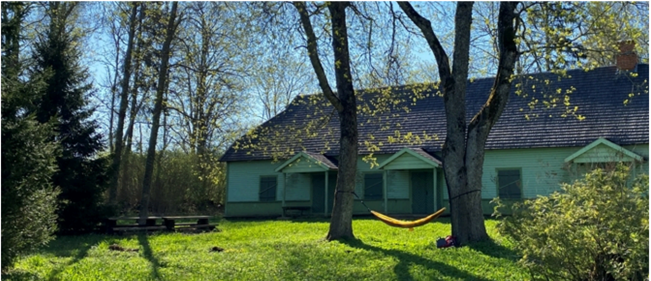
Yhden keväisen aamupäivän ajan etäkonttorini riippui Tödvan rukoushuoneen edustalla vanhojen vaahteroiden välissä! Veljesseurakunnan rukoushuone Sakun kunnan Tödvan kylässä on rakennettu vuonna 1888.