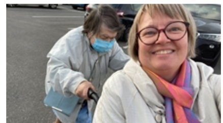
Virven kanssa vuoroin pyörätuolin kyydissä!