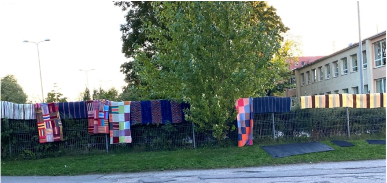
Seurakunnan matot ja tilkkupeitot tuulettuivat tiistain siivoustalkoissa.