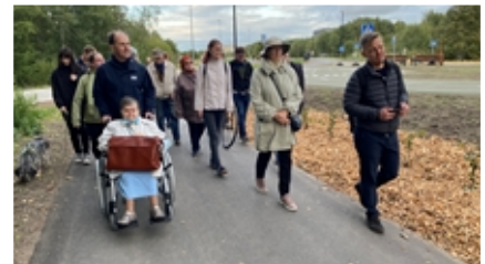
Kävimme tutustumiskierroksella Lasnamäen uusimmassa ja monipuolisimmassa puistossa.