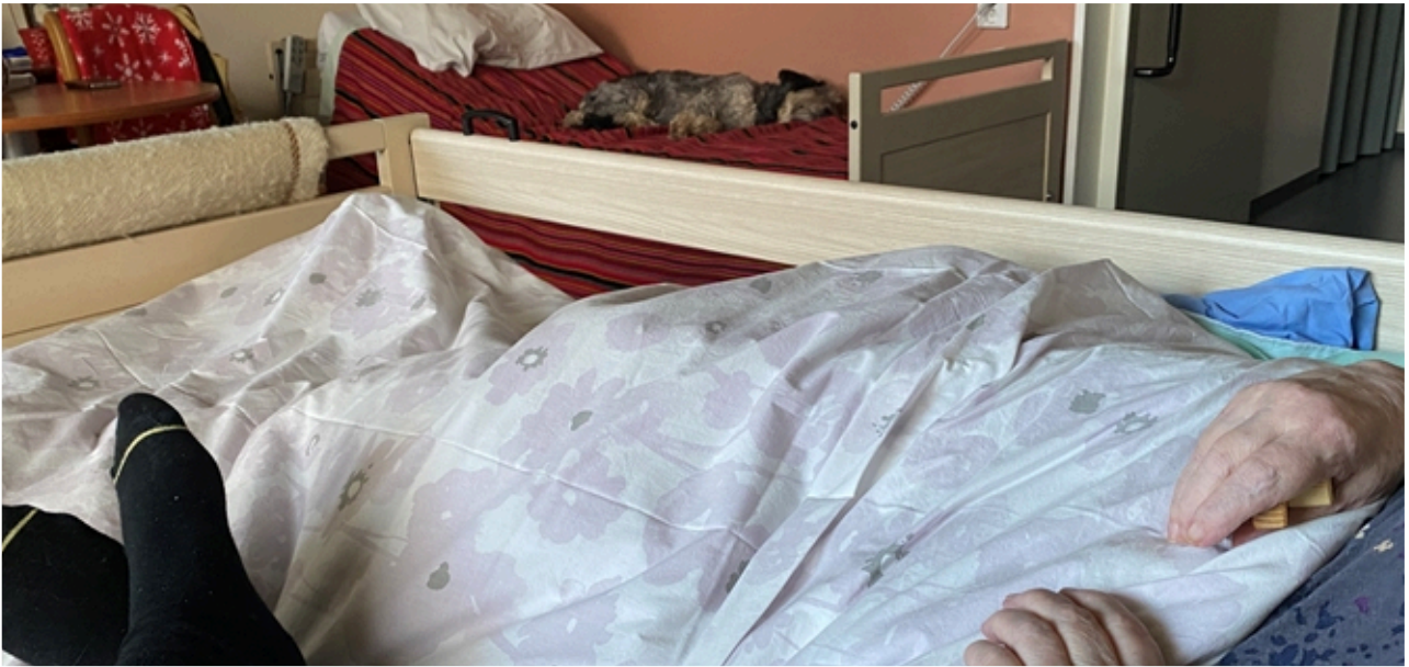
Saattohoitoviikon levollista tunnelmaa. Viimeiset päivät äiti puristi oikeassa kädessään puista kämmenristiä.