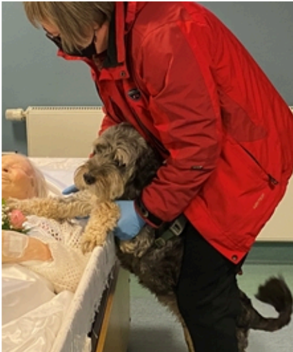
Ruska heilutti tupsuhäntäänsä hyvästiksi.