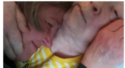
Äidiltä riitti vielä rutistuksia kaikille.