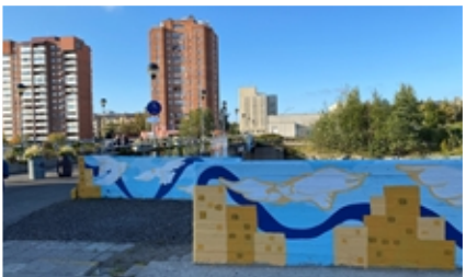
Lupasin viime kirjeessä lähettää kuvan talkoopäivän tuotoksesta, Lasnamäen Kotkappusten kaiteen uudesta maalauksesta, jonka tekemisessä olin itsekin pari tuntia apuna.

Kirjeen kirjoittamiseen tuli monen tunnin tauko. Kävin näet välillä saattamassa vielä äidin Taipalsaareltä siunauskappeliin, jossa saattelemme hänet perhepiirissä haudan lepoon jo tulevana lauantaina. Puimme äidin ylle tutut vaatteet ja toissa talvena äidin luona neulomani villasukat. Hautaustoimiston omistaja on äidin entinen oppilas ja palvelu todella sydämellinen. Saattohoitokoira Ruska oli mukana tälläkin matkalla ja heilutti häntäänsä tunnistaessaan äidin, jonka vuoteen vierellä ja jalkopäässä oli uskollisesti vartioinut viimeisen viikon.