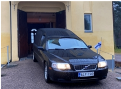
Äidin viimeinen autokyyti tänään.