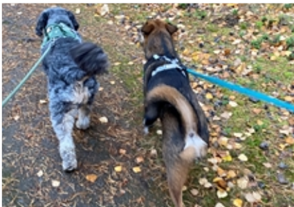
Kaverukset Ruska ja Jedi lenkillä.