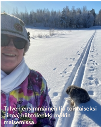
Talven ensimmäinen (ja toistaiseksi ainoa) hiihtolenkki mökin maisemissa.