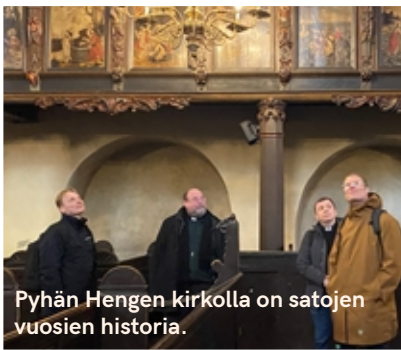
Pyhän Hengen kirkolla on satojen vuosien historia.