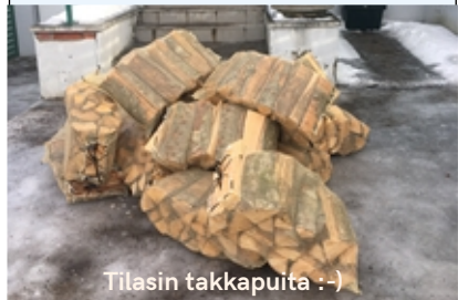
Tilasin takkapuita :-)

* Intoa ja rohkeutta pitää ilosanomaa esillä, avointa mieltä kohdata ihmisiä.