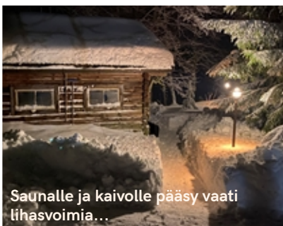
Saunalle ja kaivolle pääsy vaati lihasvoimia...