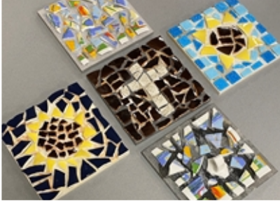
Keskeneräisiä mosaiikkitoita (saumaus jäi toiseen kertaan).