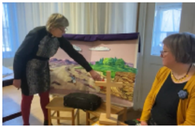
Maaliskuun kirkkotunnilla puhuimme kahdesta talonrakentajasta.