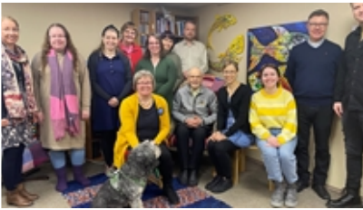
Lähetit koolla Lasnamäellä.