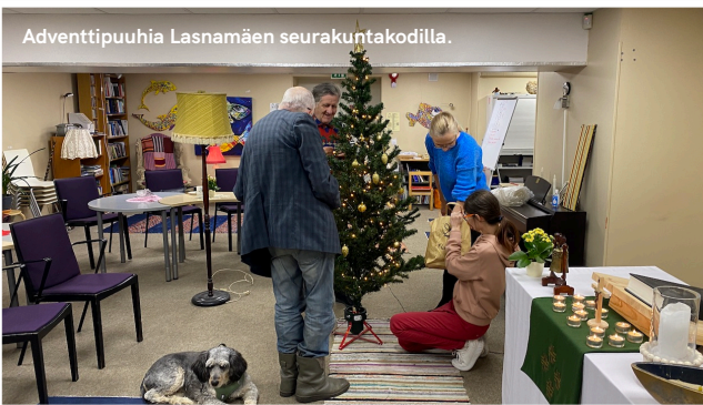
Adventtipuuhiä Lasnamäen seurakuntakodilla.

Tuo otsikossa siteerattu Jesajan profetia tuli mieleen kuullessani Ukrainan pimenneistä kaupungeista ja kuoleman varjosta. Meitäkin on kehoitettu varautumaan sähkökatkoihin. Jeesus-valo ei onneksi ole riippuvainen minkään valtakunnan sähköverkoista!